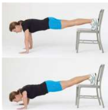
pompes jambes surélevés