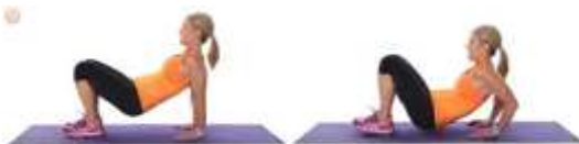
dips (mains sur marche)