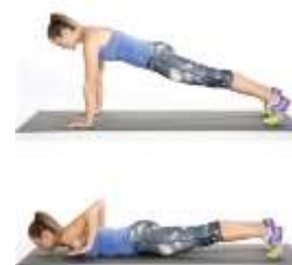
Pompes plat ventre – mains décollées – remontée