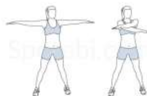
ciseaux de bras (2 petits devant + 1 ouverture)