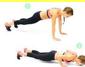
pompes coudes serrés