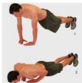
Pompes mains serrés